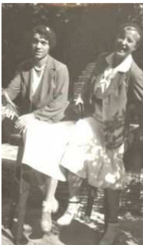
Stanisława Walasiewicz i Jadwiga Wajs