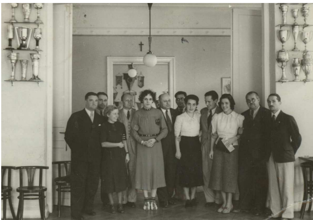
Stanisława Walasiewicz w otoczeniu działaczy sportowych