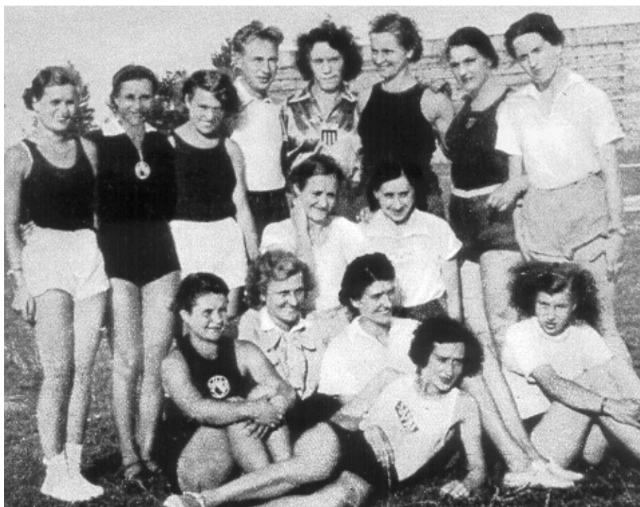
Zgrupowanie przed I Mistrzostwami Europy Kobiet (Wiedeń 1938)