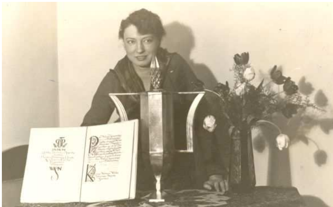
Halina Konopacka - honorowa nagroda za najlepszy wynik sezonu 1929