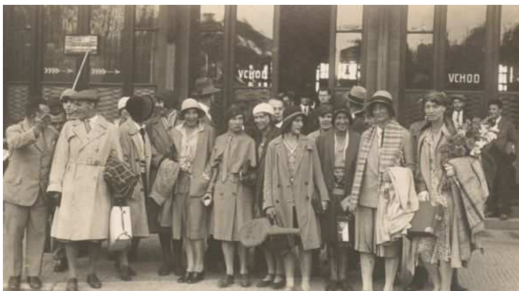
Praga 1930 - przyjazd na Światowe Igrzyska Kobiet