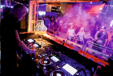
Scena Letnia teatru