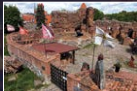
Ruiny Zamku Krzyżackiego