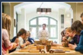
Muzeum Toruńskiego Piernika