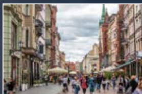
Starówka wpisana na Listę UNESCO

Odkryj skarby Torunia, wyjątkowego miasta wpisanego na Listę Światowego Dziedzictwa UNESCO, które od wieków dumnie kulturuje kopernikańskie dziedzictwo. To jedyne miejsce na świecie pachnące piernikami. Poczuj unikalny klimat miasta, które rocznie odwiedza ponad 2 miliony turystów.