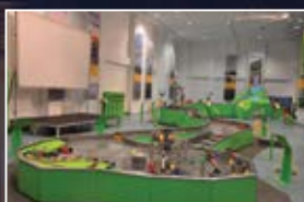
Centrum Nowoczesności "Młyn Wiedzy"