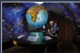
Dom Mikołaja Kopernika